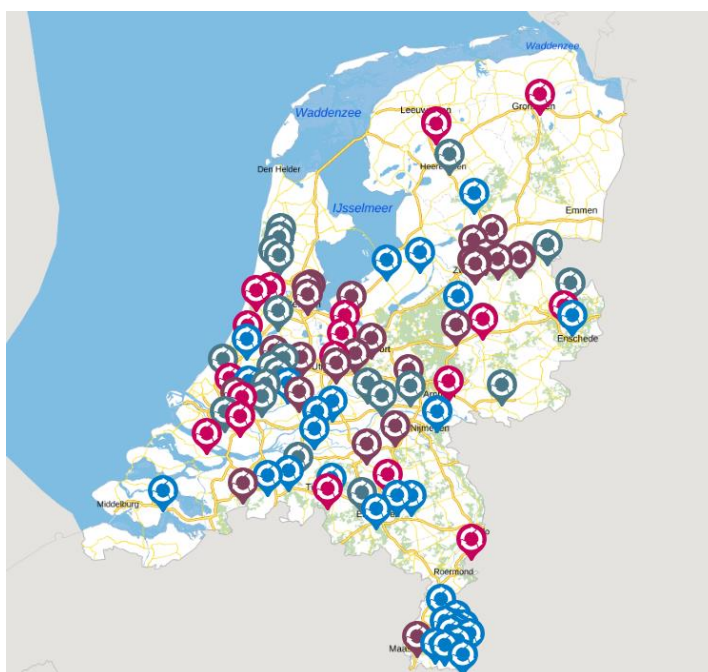
Figuur 1. De overzichtkaart van CA's in Nederland. Zichtbaar is dat er in het noorden een beperkt aantal CA's zijn.

In dit rapport staan de bevindingen van deze inventarisatie.